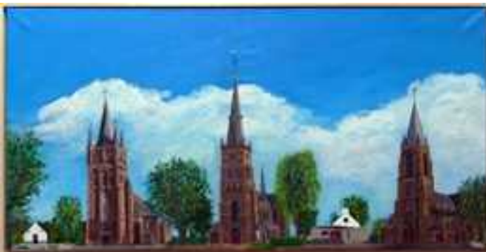
Foto: Clemens Stolwijk, De Kerken Veldhoven Atelier: hoek Vloeteind links van Biezenkuilen 105