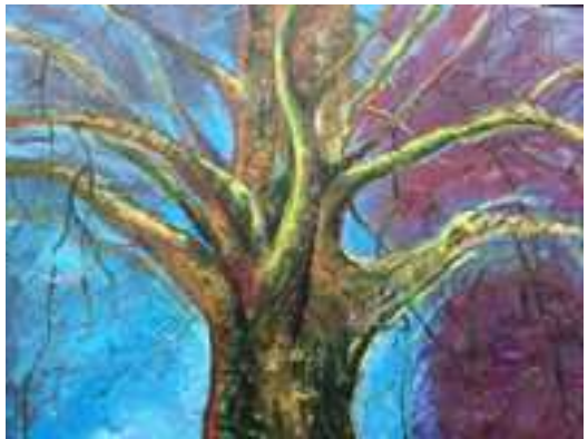
Foto: Elly Dolman- Vos, Wilhelminaboom Zeelst (fragment) Atelier: Biezenkuilen 64

Het thema van de expositie is “naar 100 jaar Veldhoven”. Dit is gekozen omdat in 2021 het 100 jaar geleden is dat de Gemeente Veldhoven is ontstaan uit de samenvoeging van de toenmalige 4 kerkdorpen.