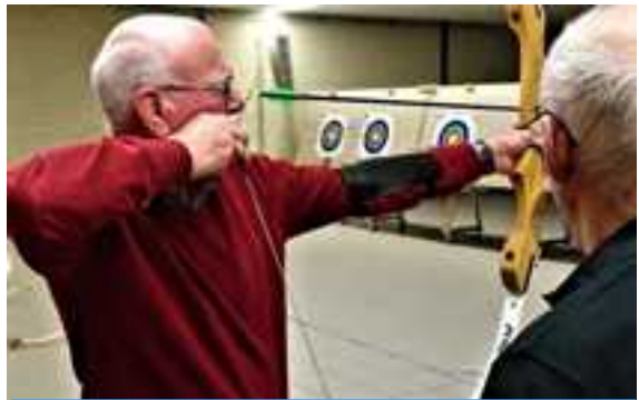
Vrijwilligersdag bij Handboogvereniging V.Z.O.D.